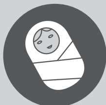
Пологи та неонатальна допомога