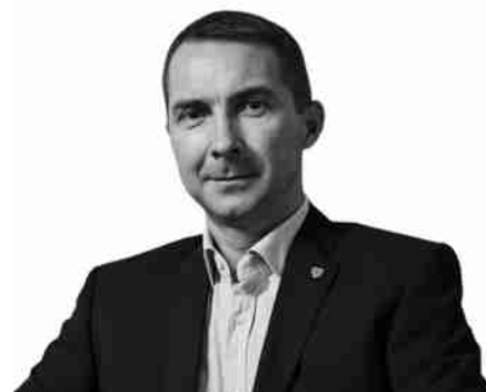
Олег Петренко, голова Національної служби здоров'я України

Аби не пропустити це майбутнє і бути готовими до нових правил, заклади повинні уже сьогодні подбати про три важливі кроки: автономізуватися (перетворитися з комунальних/державних бюджетних установ у комунальні/казенні некомерційні підприємства), комп'ютеризуватися (мати комп'ютери, мережу та доступ до інтернету на робочих місцях) і підключитися до Електронної системи охорони здоров'я через відповідну медичну інформаційну систему (МІС). Всі дані про надану пацієнтам медичну допомогу будуть переведені в електронний формат, адже тільки так можна гарантувати їхню достовірність. На основі цих достовірних даних НСЗУ заплатить за договором - вчасно та у повному обсязі.