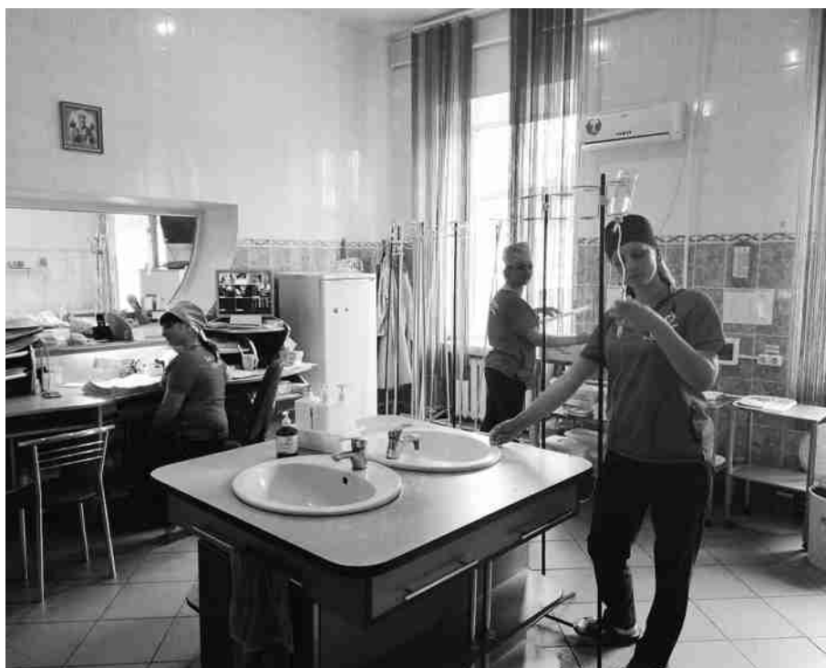
Робота в блоці інтенсивної терапії інсультного відділення №22 Вінницької обласної психоневрологічної лікарні ім. акад. О.І. Ющенка.