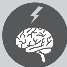
Лікування мозкових інсультів